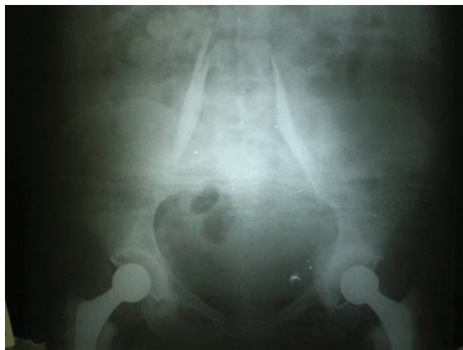
Figura 1 – Cateteres dentro do Compartimento do Psoas.

A utilização de cateter bilateral no plexo lombar para ATQ bilateral ainda não havia sido relatada. Pela administração de