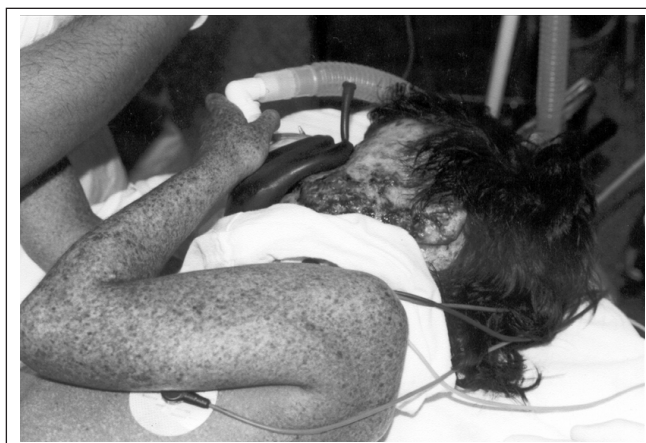
Figure 1 - Patient brings the mask to her face

In the preanesthetic evaluation for this surgery patient was, with her mother, in respiratory isolation in a poorly lit environment. At physical evaluation she presented right ectropium, right conjunctiva opacification with a lesion close to the pupil, upper lip retraction, major sialorrhea, retrognathism and mouth opening limitation with Mallampati class III. There was also marked poikiloderma with actinic keratosis throughout the body, but especially in areas exposed to UV radiation. Facial sinus X-ray showed maxillary sinuses opacification and ethmoidal cells. Skeletal scintigraphy, total abdominal echography and brain CT were normal. Lab tests revealed mild leucocytosis and increased VHS. Other preoperative tests were normal. Patient was under oral isotretinoin (10 mg) once a day and intravenous 5-FU (250 mg) once a week. Patient was premedicated with oral midazolam (10 mg) 30 minutes before surgery, what has made her relaxed and cooperative. Patient was admitted to the operating room without venous access and was monitored with pulse oximetry, cardioscopy, precordial stethoscope, noninvasive blood pressure and capnography. Due to previous experiences, the patient asked to hold the facial mask in place during beginning of induction (Figure 1).