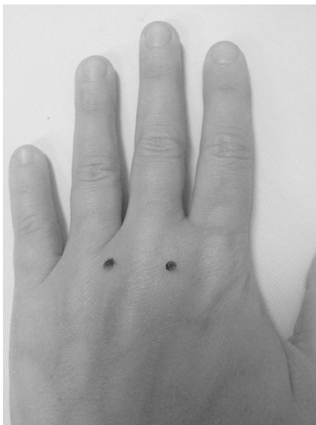
Figura 4 Bloqueio transmetacarpiano com a mão estendida. Os pontos de referência foram marcados para facilitar a administração da solução anestésica. Detalhes no texto.

que contato ósseo seja sentido 2,3,5,8,9 (fig. 5). Então, a agulha deve ser retirada lentamente até que a solução anestésica (cerca de 2 mL) seja administrada facilmente no espaço existente entre o periósteo e o tendão flexor. À medida que a solução anestésica é aplicada, observa-se turgescência local e ligeira flexão do dedo. As vantagens desse método incluem injeção única, ausência de risco de trauma mecânico direto de feixe neurovascular e rápida instalação da anestesia. Porém, o procedimento inclui riscos, como lesão do tendão e potencial infecção em espaço fechado, pois ele viola a bainha sinovial flexora; 2,3 ainda mais, comparação entre o bloqueio subcutâneo e o transtecal, usados em 162 voluntários, mostrou que esse último método anestésico é o que produz mais dor durante a injeção, desconforto esse que persiste por até 24 horas. 6