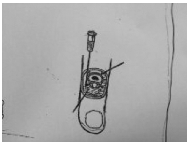
Figura 1 Corte transversal da base de falange proximal de dedo de mão. Note-se o posicionamento dos nervos e vasos digitais dorsais (seta à direita) e ventrais (seta à esquerda). Veja-se, também, a agulha para bloqueio desses nervos por via dorsolateral da base do dedo. Modificada da Figura 10-17 (A) de Bridenbaugh LD, The upper extremity: somatic blockade , in Cousins MJ, Bridenbaugh PO, Neural blockade, in Clinical anesthesia and management of pain , 2ª ed., Philadelphia, JB Lippincott Co, 1988, 412-415.

Em primeiro lugar, é preciso conhecer as contraindicações para a feitura desses bloqueios e que são principalmente