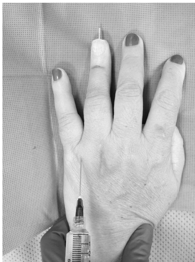
Figura 3 Bloqueio anestésico de dedo anular por via transmetacarpiana. Inserção da agulha pelo lado dorsal da mão, a 1 cm, aproximadamente, da articulação metacarpofalagiana e a meia distância entre dois ossos metacarpianos. Outros detalhes no texto.

A técnica transtecarpiana 1,3 para bloqueio de nervos digitais é executada com os dedos estendidos, pelo lado dorsal da mão, mais fino do que o palmar, a cerca de 1 cm, aproximadamente, das articulações metacarpofalagianas e a meia distância entre tais ossos metacarpianos (fig. 3); a técnica envolve a introdução da agulha e o avanço dela até que a resistência da aponeurose palmar seja percebida e, então, 2-3 mL de solução anestésica sem epinefrina devem ser injetados enquanto a agulha vai sendo lentamente retirada. O mesmo procedimento é feito do outro lado do dedo. É possível efetuá-lo pelo lado palmar da mão e igualmente