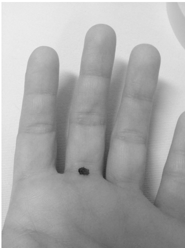
Figura 6 Local para bloqueio de dedo de mão com uso de apenas uma injeção de anestésico local aplicada no espaço subcutâneo e aproximadamente ao nível do ponto médio de prega interdigital palmar.

Quando vários dedos estiverem envolvidos no ato operatório, uma boa opção é o bloqueio anestésico no nível do punho. 1