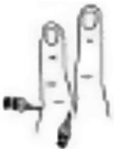
Figura 2 Bloqueio subcutâneo de nervos dorsais e palmares de dedo indicador direito. Ilustração: Gladys N. dos Reis.