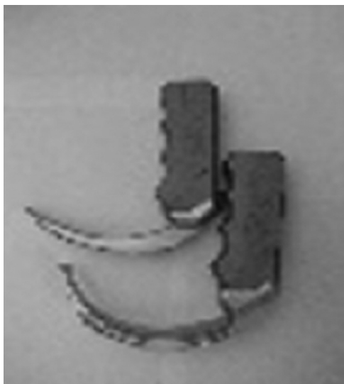
Figura 2 Figura mostrando as lâminas convencional e angulada (D-blade) do videolaringoscópio C-MAC.

participantes com os laringoscópios Macintosh e McCoy. A diferença no tempo de intubação entre os videolaringoscópios C-MAC e C-MAC D-blade pode ser devido à diferença na forma os dois dispositivos. O C-MAC convencional incorpora o laringoscópio Macintosh normal, enquanto o videolaringoscópio C-MAC D-blade tem uma angulação acentuada embutido (fig. 2). Esse aumento da angulação de 18° do C-MAC (tamanho 3) para 40° no C-MAC D-blade requer o uso de um estilete curvo e resulta em mais manipulação e ajuste do tubo endotraqueal através das pregas vocais.