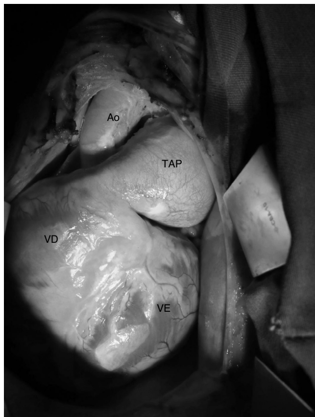
Figura 2 Aneurisma de TAP e aumento do VD. TAP, tronco de artéria pulmonar; VD, ventrículo direito; Ao, aorta; VE, ventrículo esquerdo.

Solicitou-se então ecodopplercardiografia, que revelou dilatação e hipertrofia moderada de ventrículo direito, dilatação importante de tronco e ramos de artéria pulmonar e displasia com insuficiência importante de valva pulmonar. A pressão média da artéria pulmonar foi estimada em 30 mmHg (valor normal de referência: 10 a 18 mmHg).