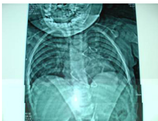
Figura 1 Fragmento de um cateter do tipo port-A cath que se partiu em menino de 2 anos com linfoma linfoblástico agudo. O fragmento estava alojado no ventrículo direito e alcançava a veia pulmonar principal.

vazamentos, remoção acidental, migração da extremidade do cateter, fratura, embolização, infecção, oclusão do cateter, perfuração venosa, perfuração atrial, arritmia e flebite. 1-3 Também já foi comunicada a ocorrência de fragmentos de cateter centralmente embolizados no coração e na artéria pulmonar. 1,4,5 Se os fragmentos migrados não forem removidos, podem causar complicações graves e também óbitos. As complicações em longo prazo têm variado entre 21 e 33% 6-8 e o percentual de óbitos varia entre 23,7 e 60%. 6-9 A remoção percutânea desses fragmentos migrados diminuiu a necessidade de uma cirurgia importante.